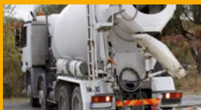
BÉTON PRÊT À L'EMPLOI