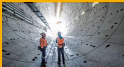
TUNNELS ET TRAVAUX SOUTERRAINS