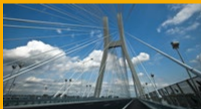
BÉTON D'INFRASTRUCTURE ET OUVRAGES D'ART