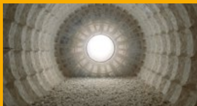
INDUSTRIE DU CIMENT